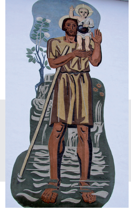
Christophorus

Die Glasfenster der Kirche stellen die vier Evangelisten dar und das Fenster im Presbyterium zeigt eine Pietadarstellung. Die Fenster wurden 1952/1953 durch Spenden von Erlauer Bürgern finanziert.