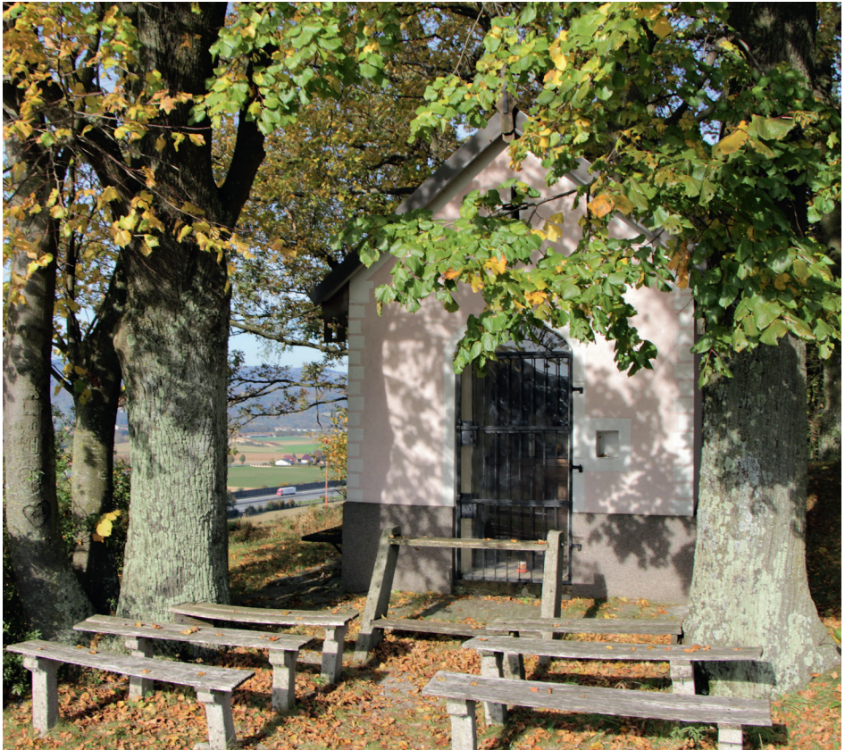
Ansicht der Eichbergkapelle

Quellenangaben: Memorabilienbuch der Pfarre | Dehio |