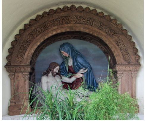
Pieta in der Eichbergkapelle

Die Eichbergkapelle wurde auf Anregung des Pfarrers Julius Kroiss als Maria-Hilf-Kapelle errichtet und im Juni 1880 eingeweiht. 1920 schuf Josef Schagerl für die Eichbergkapelle eine Pieta zum Gedenken an die Gefallenen des ersten Weltkriegs.