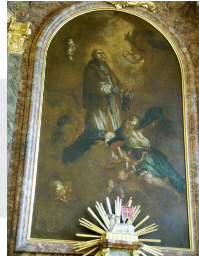
Hochaltar Hl. Nepomuk

Die Säulenkapitelle tragen zwei Blumenvasen. Zwischen den Säulen ist das Altarbild angebracht, welches den Hl. Nepomuk stehend darstellt. Das Bild ist eine Kopie nach der Schule des Joseph von Führich um die Mitte des 19. Jahrhunderts. Darüber erhebt sich der zweite Teil des Aufsatzes bis zum Abschluss des Kirchengebäudes, im Mittelfeld steht eine Statue der Unbefleckten Jungfrau mit Mond unter den Füßen und einem Strahlenkranz um ihr Haupt. Der gesamte Aufsatz schließt mit einem Kreuz.