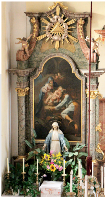
Linker Seitenaltar – Marienaltar

Der rechte Seitenaltar ist der Allerheiligsten Dreifaltigkeit geweiht, das Altarbild stellt den Hl. Leonhard, ein Gemälde aus dem 19. Jahrhundert dar. Das ursprüngliche Altarbild – ein Werk des Kremser Schmidt – den Hl. Franziskus darstellend, ist leider