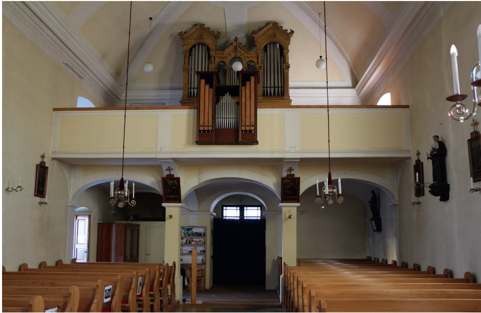
Blick Richtung Orgelempore