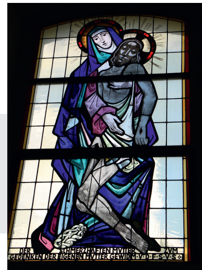
Pieta im Chor

Die Glasfenster der Kirche stellen die vier Evangelisten dar und das Fenster im Presbyterium zeigt eine Pietadarstellung. Die Fenster wurden 1952/1953 durch Spenden von Erlauer Bürgern finanziert.