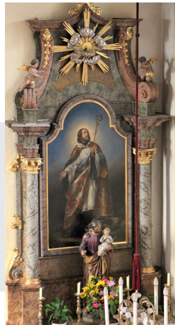
Rechter Seitenaltar – Josefaltar

verschwunden. Im Auszug befindet sich ein Wolkenkranz mit Heiliger-Geist-Taube vor einem großen Strahlenkranz.