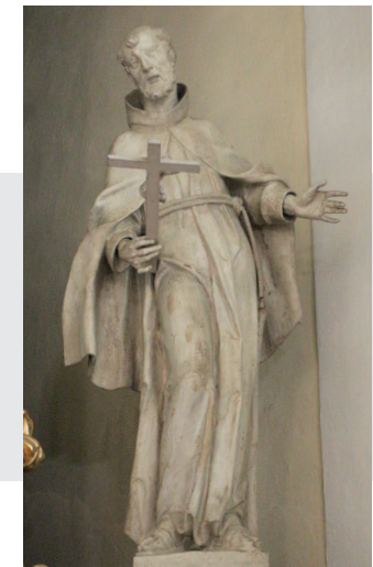
Hl. Franziskus Seraph

An der Nordseite befindet sich die Kanzel mit einem Bildnis des Hl. Geistes am Schalldeckel. Das Speisgitter wurde im Zuge der Errichtung des Volksaltars entfernt.