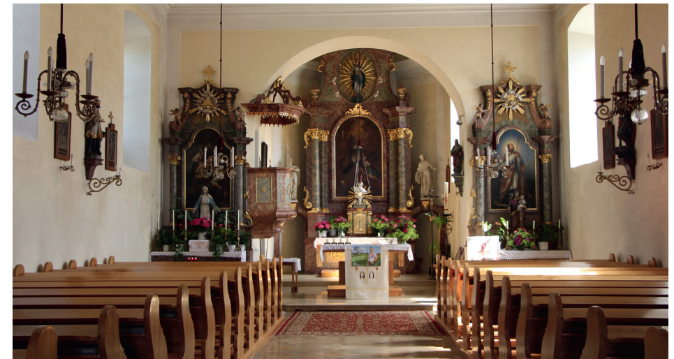
Blick Richtung Hochaltar

Der Chorbogen ist unprofiliert. Die Südepore, die dreiachsig ist, steht auf schlanken Pfeilern. Das Innere des Kirchenschiffs ist als einfacher Rechtecksaal mit hohem Spiegelgewölbe zu beschreiben, von welchem Putzbänder radial auf das Gesimse zulaufen.